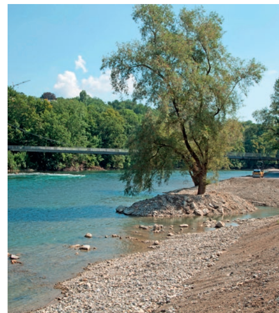
Die aufgeschütteten Kiesbänke bilden eine naturnahe Flusslandschaft.

Stadt Zürich, der «naturemade star»-Fonds des Energiedienstleisters EWZ, die Umweltorganisation WWF in Kooperation mit der Zürcher Kantonalbank sowie dem Bundesamt für Umwelt. pd