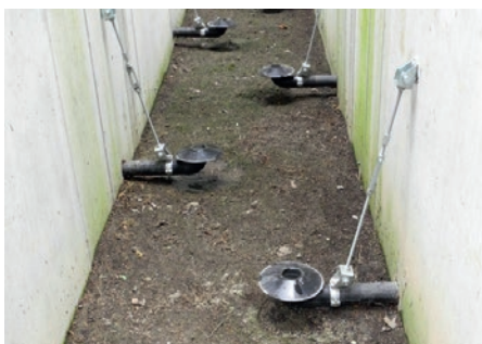
Abbildung 1 zeigt die Regenabwasserbehandlung mittels eines synthetischen Adsorbers, bevor das Wasser direkt in den Grundwasserleiter versickert wird.