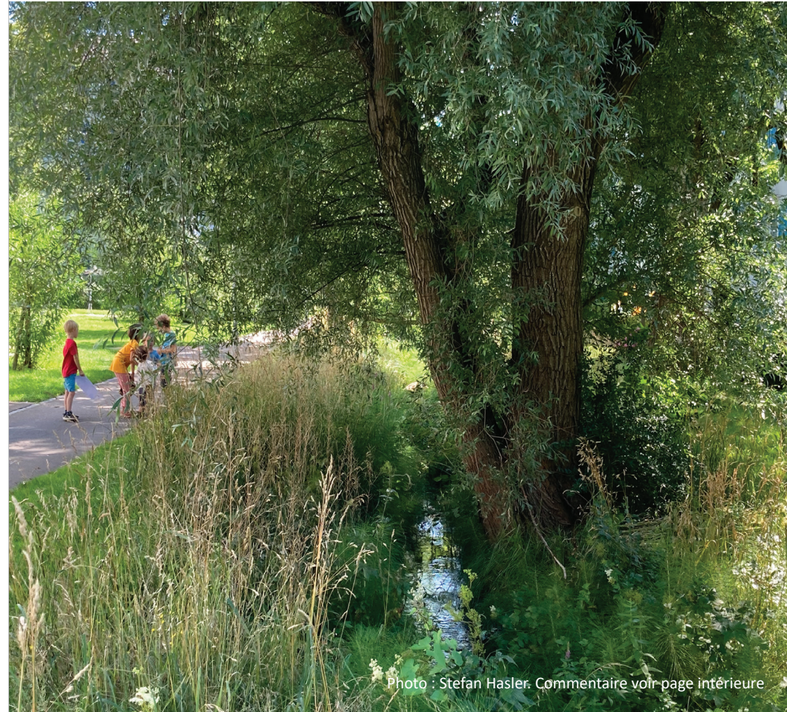
Commentaire voir page intérieure