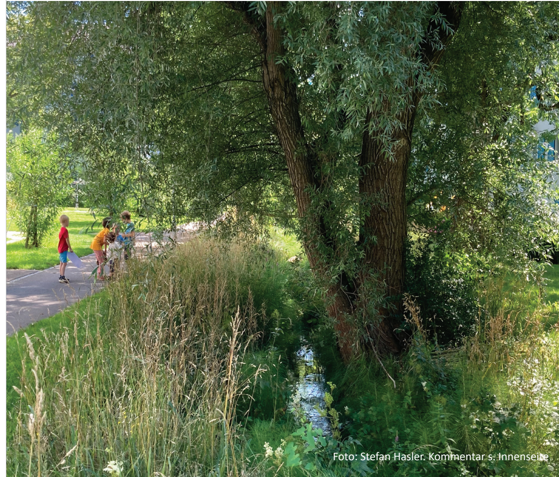
Kommentar s. Innenseite

Donnerstag, 2. Mai 2024 in der Markthalle Basel