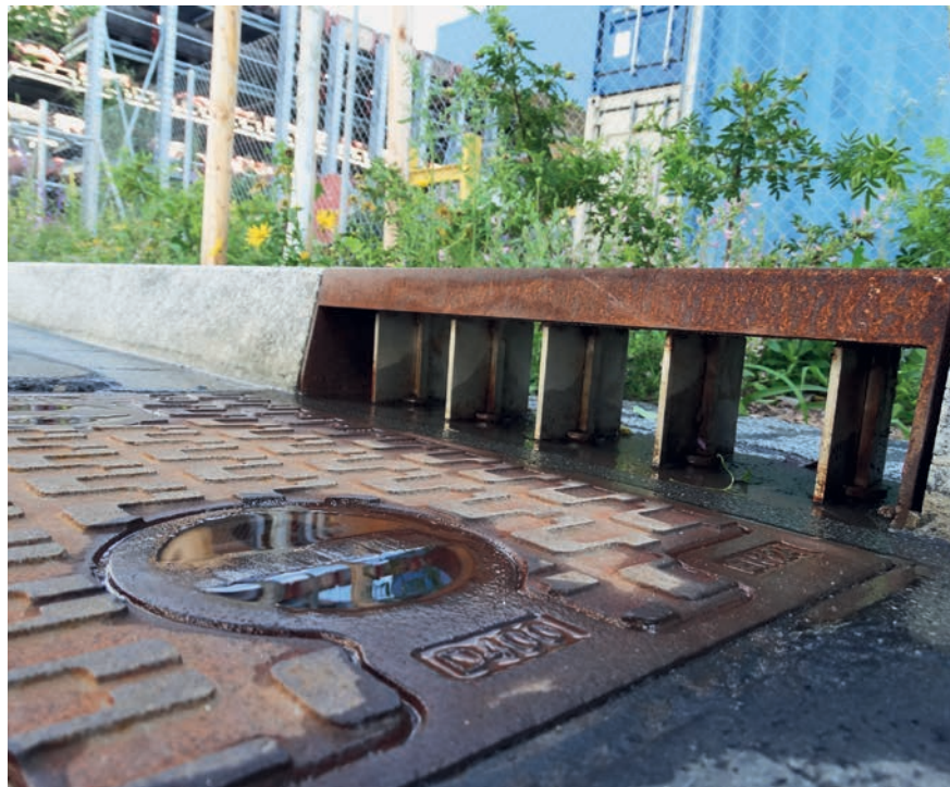
Giessereistrasse in Zürich: Das Regenwasser fliesst nur noch während der Wintermonate, in denen Streusalz zum Einsatz kommt, in die Kanalisation. In der restlichen Zeit wird das Regenwasser in den Vegetationsbereich umgeleitet, wo es langsamer abfließt und über die Bäume verdunsten kann (Schlammsammler geschlossen, Randstein geöffnet).

Im Projekt wird das «einbeziehen aller Ansprechgruppen» als Erfolgsfaktor betont. Es braucht folglich mehr als nur reines Expertenwissen in der Projektorganisation. Hat der VSA als Wasser-