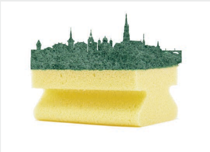
Fig. 1 Schwammstädte saugen Regenwasser auf wie ein Schwamm.