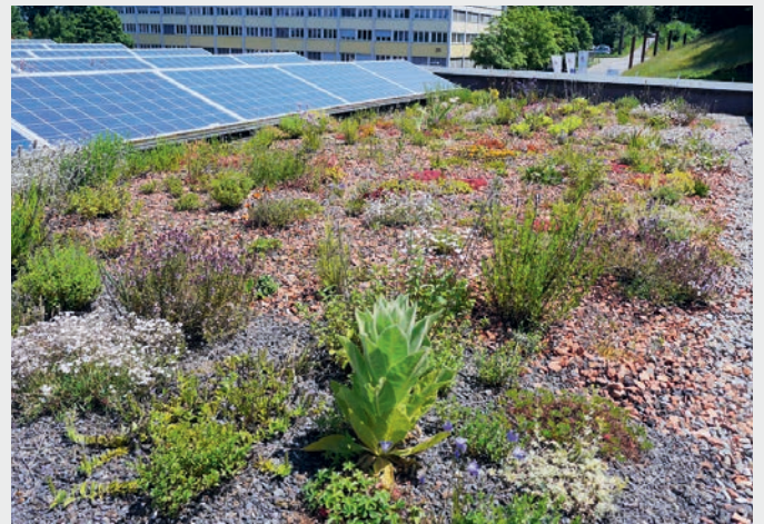
Fig. 2 Begrünte Dächer und Fassaden speichern einen Grossteil des Niederschlags, reduzieren durch die Evapotranspiration die Oberflächentemperatur und fördern die Artenvielfalt.

unseren Siedlungen, damit die Gefahren durch den Klimawandel abgemildert werden: Wasser muss in die Gestaltung von Siedlungen und deren Infrastrukturen integriert, zurückgehalten, verdunstet, gefahrlos abgeleitet und als Gestaltungselement genutzt werden. Dieses «klimaangepasste Wassermanagement» bietet Chancen für Mensch und Natur gleichermaßen.