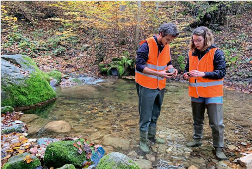
Fig. 3 Beurteilung des Zustandes der Einleitstelle im Feld aufgrund des äusseren Aspekts.