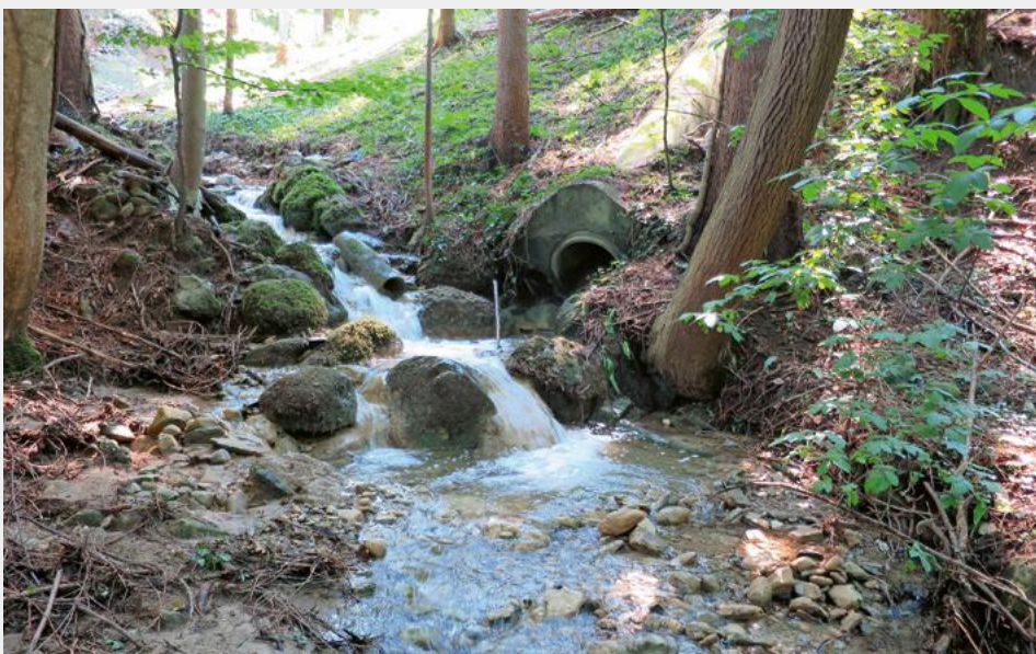
Fig. 2 Beispiel einer Einleitstelle im Einzugsgebiet des Abwasserverbandes.