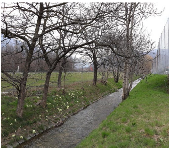
Fig. 1 Vor der Revitalisierung: Roggia dei Mulini Nord zwischen Autobahn und Fussballplatz.

Das neue Flussbett wurde mit dem Ziel entworfen, die Flussdynamik wiederherzustellen, die freie Fischwanderung zu ermöglichen und die ökologische Vernetzung zwischen dem linken Hangfuss und der Aue des Vedeggio wiederherzustellen (Fig. 3). Der Eingriff ist auf weitere par-