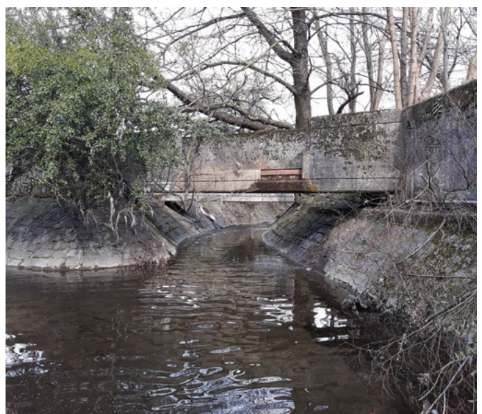
Fig. 2 Vor der Revitalisierung: Zusammenfluss von Roggia dei Mulini Nord und Ponteggia.