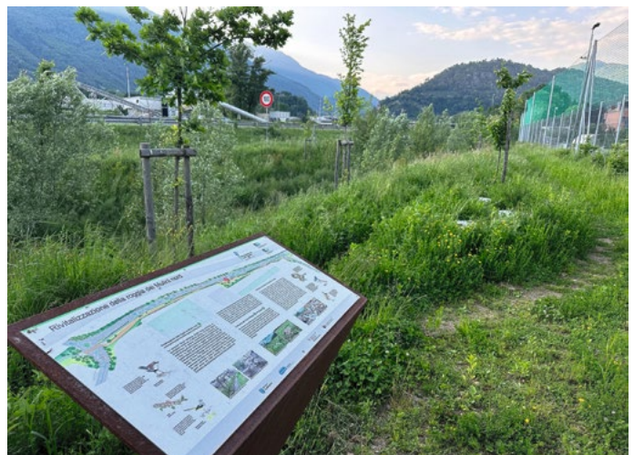
Fig. 8 Fussweg und Informationstafel nach der Revitalisierung.

wurden ebenfalls entfernt und durch für Fische durchlässige Rampen ersetzt. Die Autobahnunterführung wurde gemäss