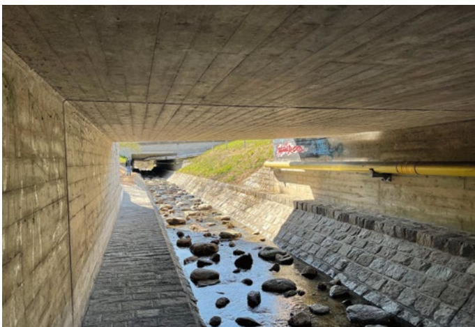
Fig. 7 Autobahnunterführung gemäss VSS-Normen gestaltet mit strukturierter Flusssohle und seitlichen Uferbänken für terrestrische Tierarten.