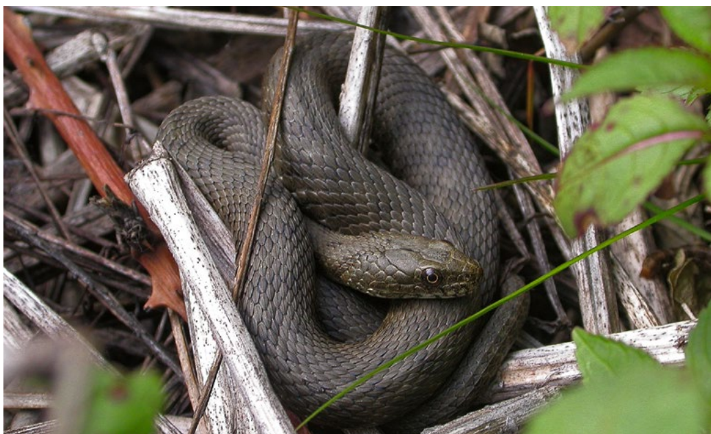
Fig. 4 Exemplar der Würfelnatter, einer national prioritären und im Tessin einheimischen Art, die nach der Revitalisierung beobachtet wurde.