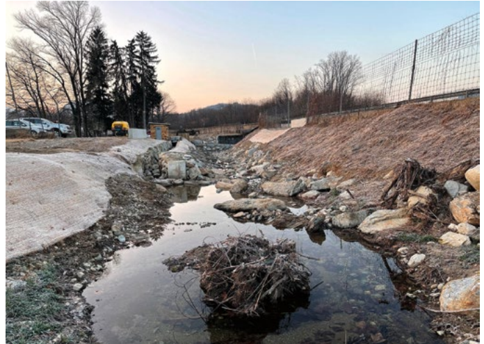
Fig. 6 Abschnitt der Roggia dei Mulini Nord während der Revitalisierung.