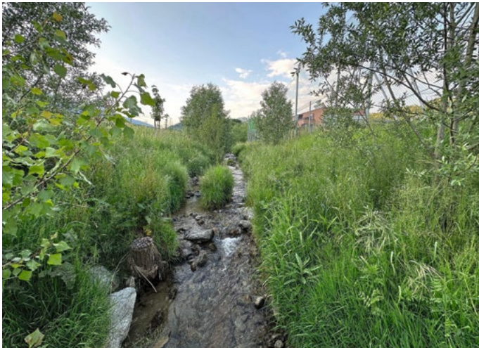
Fig. 5 Roggia dei Mulini Nord nach der Revitalisierung.